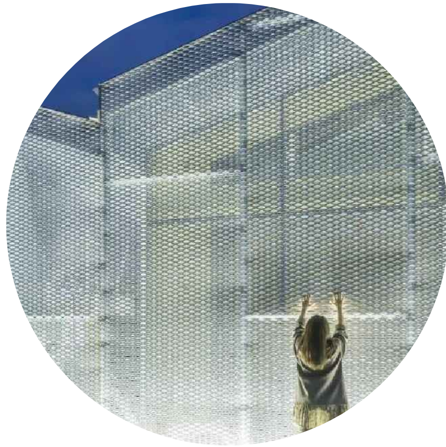
PODHLIED Z POZINKOVANÉHO TAHOKOVU, PROSVĚTLENÝ