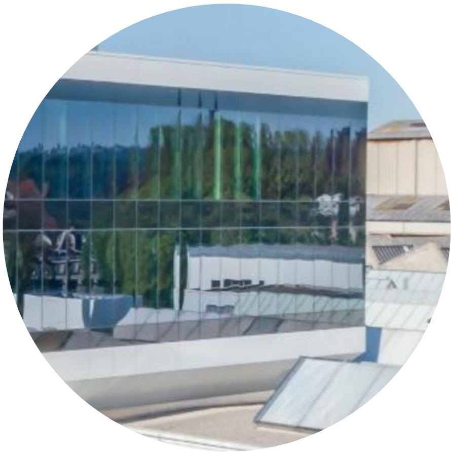
POLOSTRUKTURÁLNÍ ZASKLENÍ, PRŮHLEDNÉ A NEPRŮHLEDNÉ PANELY