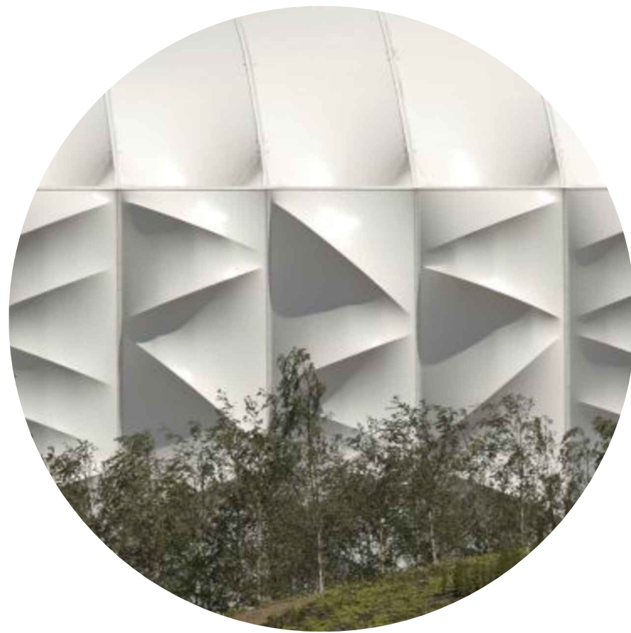
PODHLIED Z POZINKOVANÉHO TAHOKOVU, PROSVĚTLENÝ